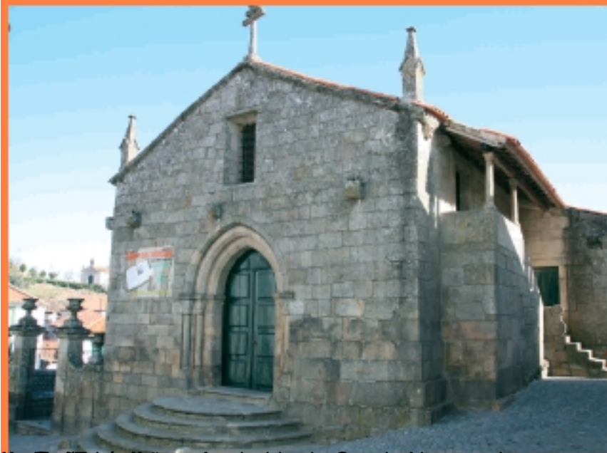
Igreja de São João, na freguesia de Granja Nova, no concelho de Tarouca, no distrito de Beira Ligeira