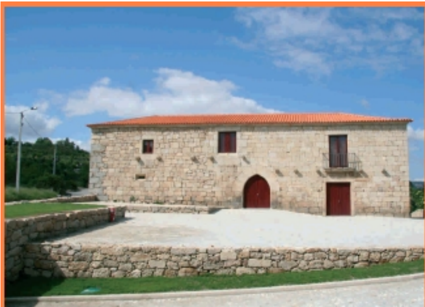
Castro de São Pedro de Tarouca, no freguesia de Tarouca, no concelho de Tarouca, no distrito de Beira Ligeira