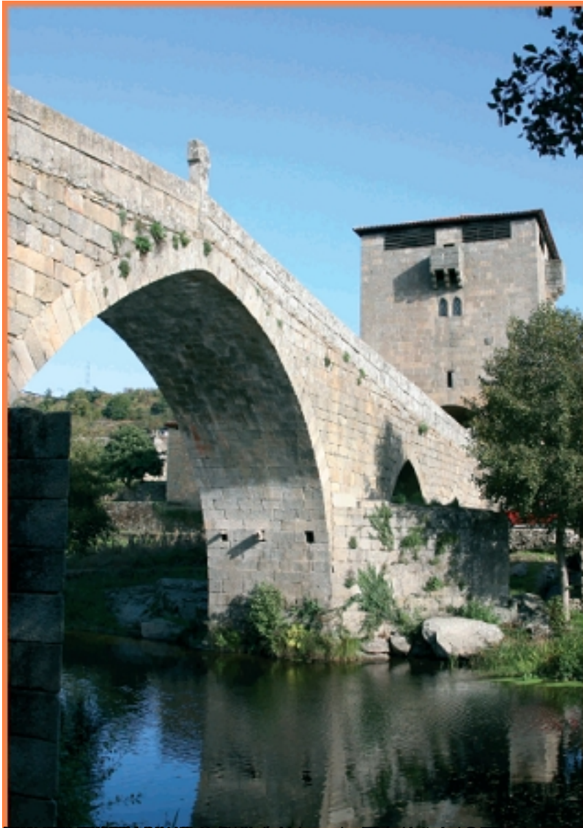
Imagem 1 - Ponte de Tarouca, construída no século XII, com o seu castelo, a Igreja Matriz e o grej