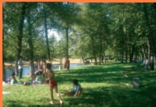
Parque de recreio da Reserva Natural do Vale do Rio Alva, no Alto, para os sacristãos