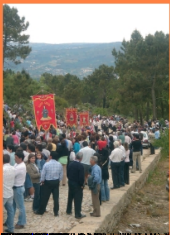
Ti Sealy Moimenta da Beira, Portugal - Alvaro Perdomo - Nofisla