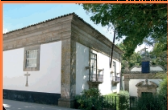
palacete dos Noronhas ou Casa de Casa