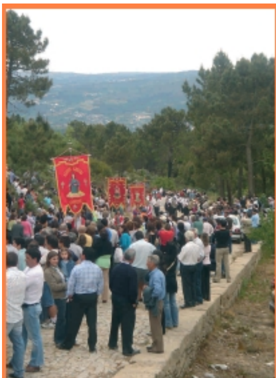
Processão da Senhora do Espírito Santo, no Alto, para os sacristãos