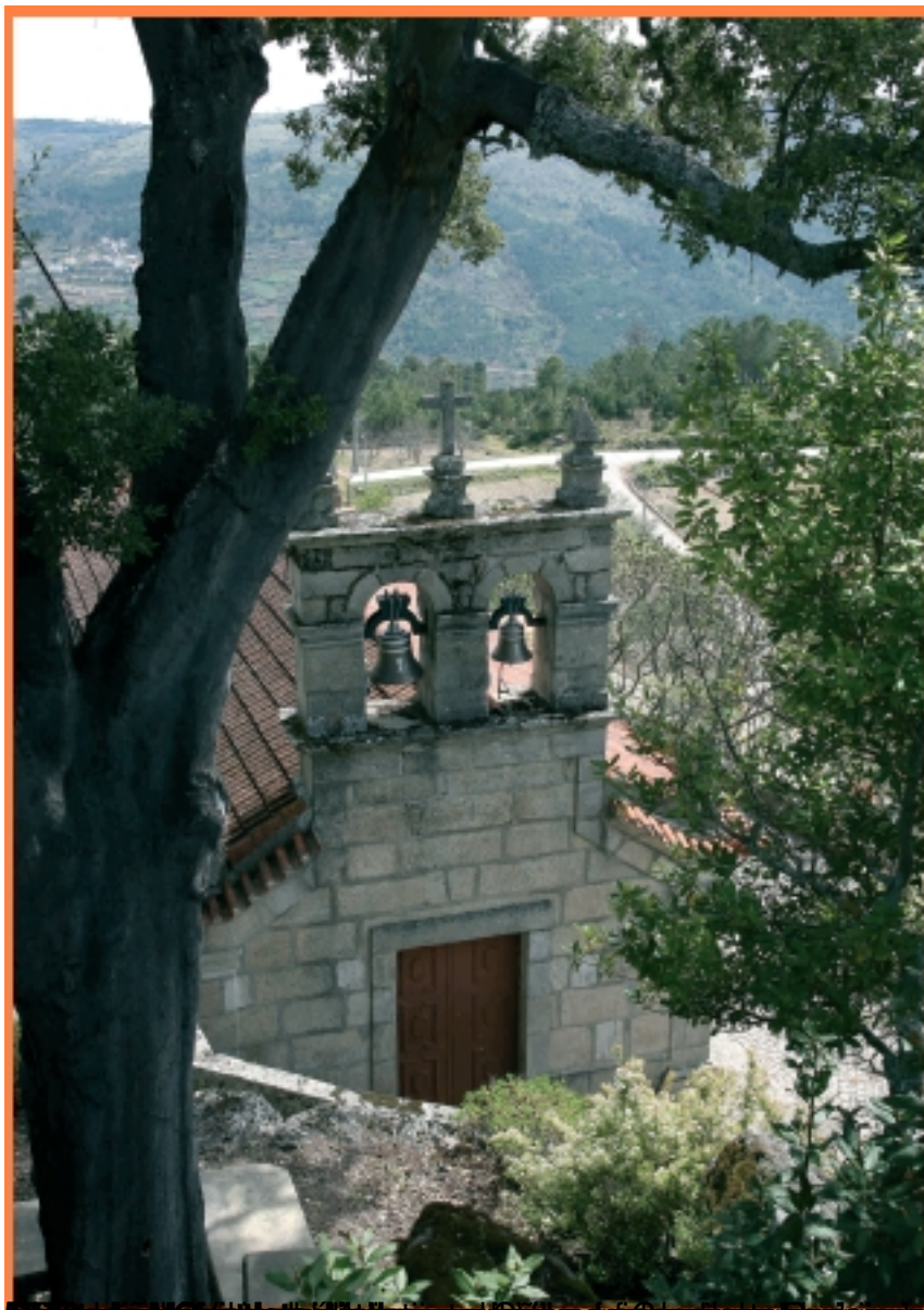
torre dos sinos do palacete do Terreiro das