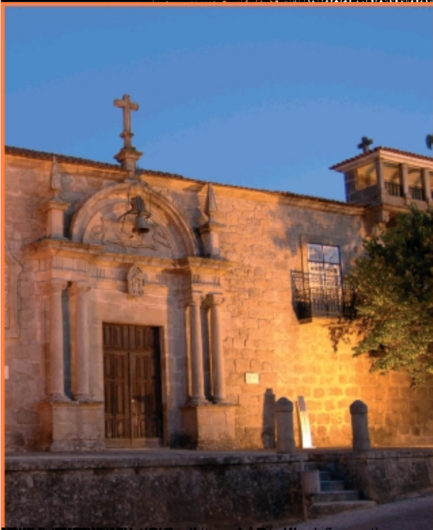
Mosteiro de São João do Vale de São João, Moimenta da Beira. O município destaca-se por possuir várias aldeias, igrejas e solares, antigo mosteiro beneditino fundado no século