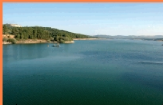
Reserva Natural do Vale do Rio Alva, no Alto, para os sacristãos