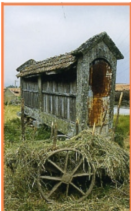
Tradição - A tradição agrícola em Cinfães é uma variedade de produtos