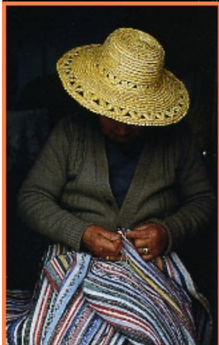
Tradição - A tradição agrícola em Cinfães é uma variedade de produtos