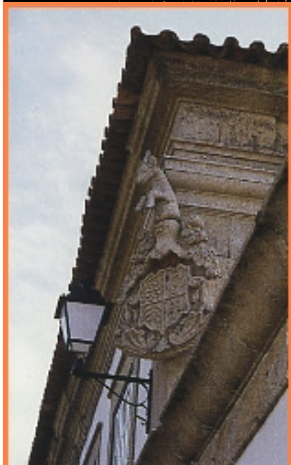
Praça do Passado de Armamar , da cidade de suas gentes, os vestígios que contam