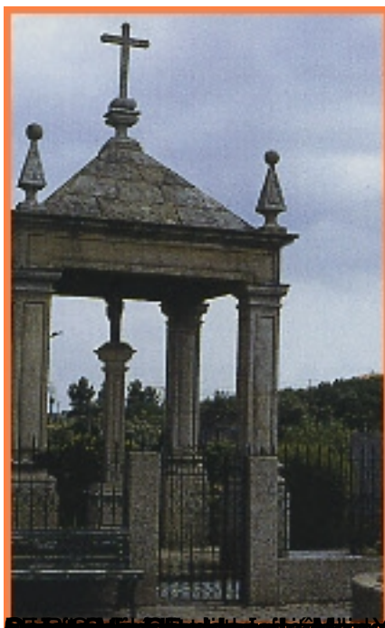
Capela do Vale do Engenho apresenta a igreja da Beata