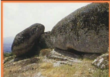
PRIMEIROS CRISTOS mais Reshais ocidentah